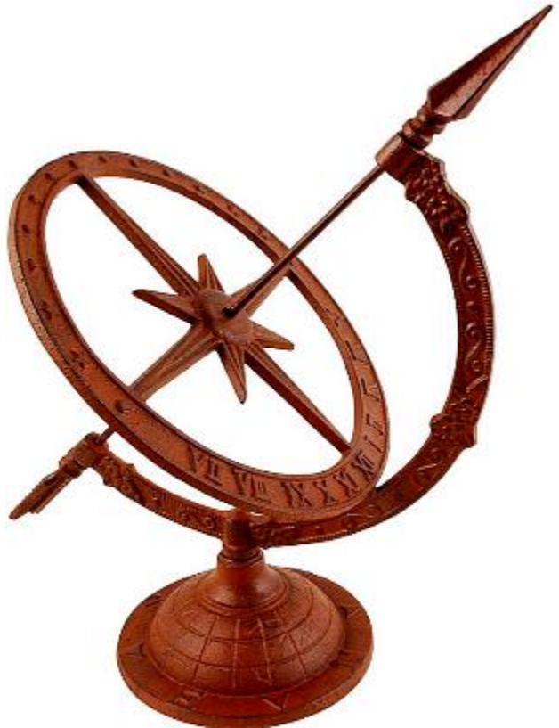
Door de zonnewijzer leerden ze de betekenis van licht en schaduw kennen

Een slotzin van mezelf: Vanuit het Licht leven betekent liefde uitdragen.