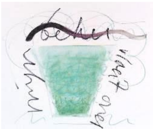
'Mijn beker vloeit over' schets van Michiel

Op de rouwkaart konden we zien dat Michiel opgroeide in een gezin met 2 broers en 2 zussen. Op de voorkant staat een tekening