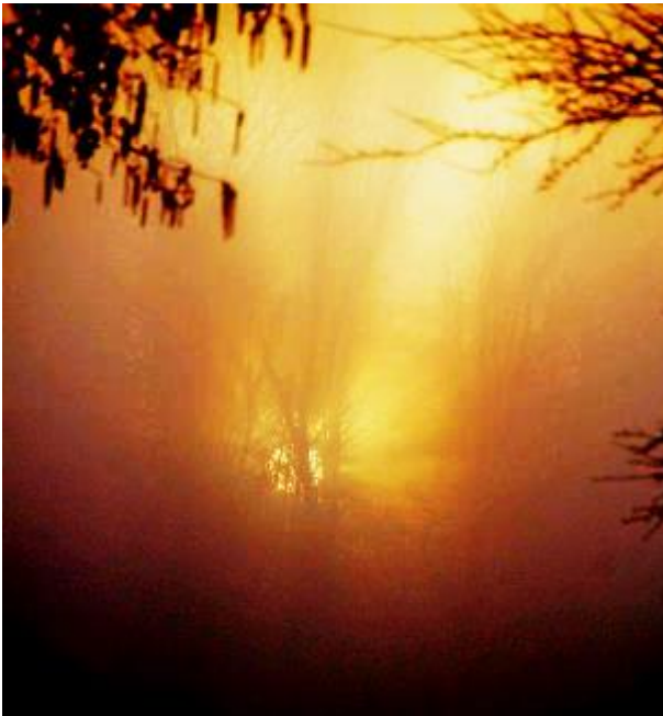
zonsopgang in het populierenbos

Gezegend is het morgenlicht dat uit de verte ons begroet, een liefde heeft ons opgericht, wij zijn gezien en het is goed. Mogen mijn uren en mijn wegen Verhelderd blijven in uw zegen.