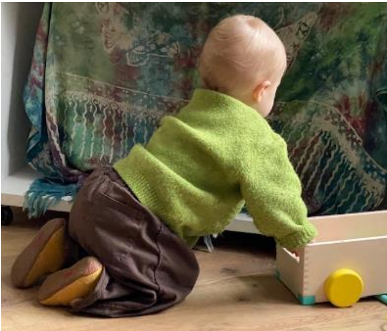
kleinzoon van Bonnie, licht als liefde

Mijn kleinzoon van 16 maanden, die twee dagen in de week bij mij verblijft, zie ik als een ware personificatie van het licht. Hij roept een liefde in mij op als oma dat inspireert om mijn beste zelf voor hem te zijn: geduldig, eerlijk, luisterend, ga zo maar door - er te zijn voor hem in het licht.