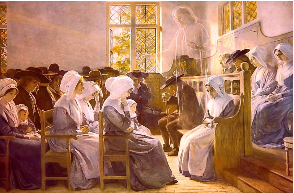
‘The Presence in the Midst’, geschilderd door James Doyle Penrose. Het laat zien hoe Christus verschijnt in een Quaker Meeting in 17e eeuwse kleding.

Veel Quakers hebben “dat van God in ieder mens” tot dogma gemaakt. Daardoor ligt kritiek op dat perspectief gevoelig, realiseer ik me. Dat is echter lang niet mijn hoofdboodschap. Die is: ‘let op je taalgebruik’!