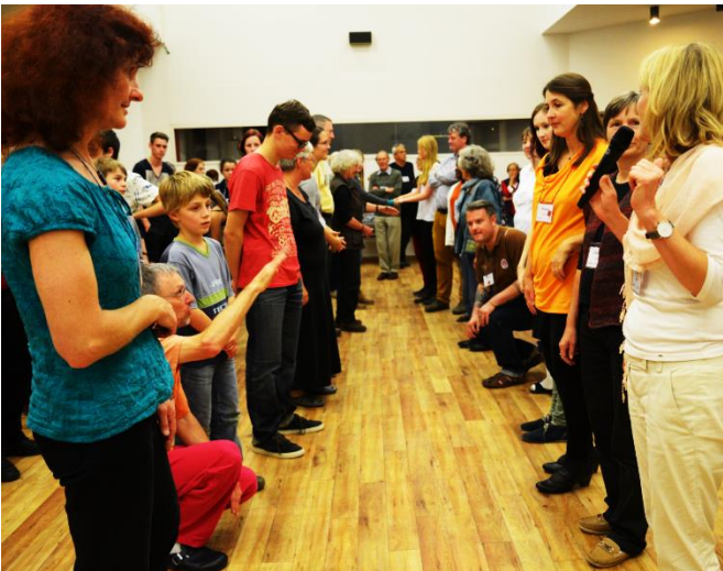
In Duitsland werd er een leuk spel gespeeld in de Algemene Vergadering

Voor mij gaat de betekenis van het Licht mijn begrip te boven. Toch denk ik dat mijn idee van het Licht nog het meest een combinatie is van de bovenstaande interpretaties. Voor mij persoonlijk staat het Licht als metafoor vooral voor het idee dat Gods Licht en Liefde universeel schijnt op alle mensen (en ook op andere levende wezens) en daarin geen uitzondering maakt. Iedereen is gemaakt naar Gods evenbeeld en gelijkwaardig. Tegelijkertijd denk ik dat dit ook betekent dat er "iets van God" of een "klein vonkje" van het Goddelijke in ons is