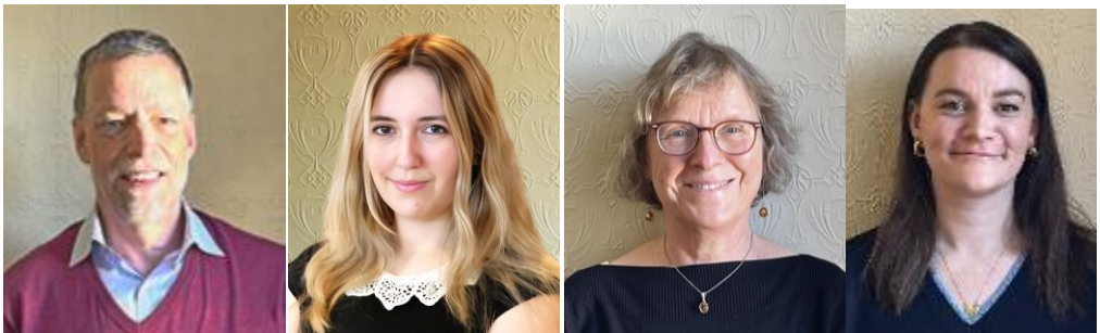
Het QCEA team in Brussel

https://www.qcea.org/homepage/dialogues-for-transformation/