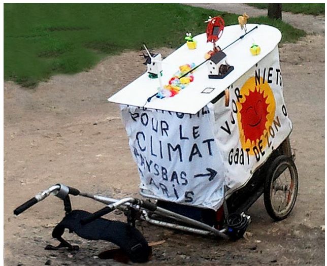
klimaatkarretje van de vredespelgrim

En dit zeg ik ook tegen mijzelf. Wat heb ik nog te zeggen en te doen. Doordat ik een oude Vriendenkring zag met foto van mij in een wit kostuum en vrolijke wandelkar, uitgezwaaid vanuit het oudste Quaker huis in Engeland, besefte ik pas goed dat je eigen reis ook die van ander kan worden. De stepping stone. De stimulans van en door een ander. Je weet het niet. You never know.