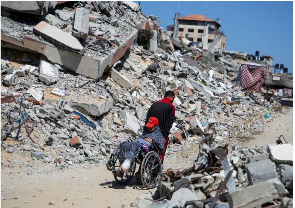
Een Palestijnse man trekt een gehandicapte vrouw in een rolstoel langs het puin van een huis dat is verwoest door een Israëliësch bombardement in Khan Younis, in de zuidelijke Gazastrook op 26 september 2024

De genocide in Gaza is een massale ramp die mensen invalide maakt. Meer dan 400 dagen van Israëliëse luchtaanvallen en constante grondaanvallen op dichtbevolkte gebieden hebben meer dan 22.500 mensen achtergelaten die verwondingen hebben opgelopen, die hun leven als invalide totaal hebben veranderd. Honderden mensen met handicaps die ze al hadden voor oktober 2023, zijn gedood of liggen nog steeds onder het puin. Negentig procent van de bevolking van Gaza is nu ontheemd, sommigen zijn zelfs meer dan twintig keer gevlucht.