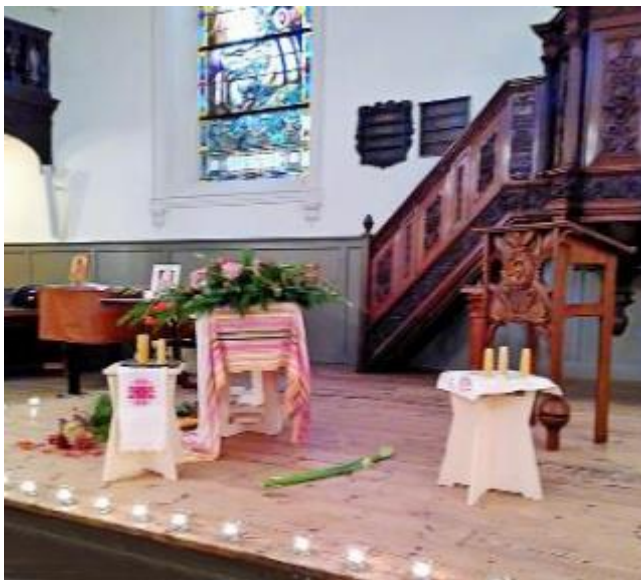
het podium in de Lutherse kerk met de kist, bloemen en lichtjes

Hij droeg een gebroken gewoontje, was actief bij de Pacifistisch-Socialistische Partij en later de Partij van de Dieren en raapte vaak zwerfvuil op van straat. Een pionier van de eenvoudige levensstijl. Een vriendin – die een aantal van zijn Haiku's voorlas – zei 'je hebt me geleerd hoe eenvoudig schoonheid kan zijn': een kamperfoelie bes voor het raam werd omschreven als 'hun gedeelde geheim'. Een neef zei dat in zijn herinnering een bezoek