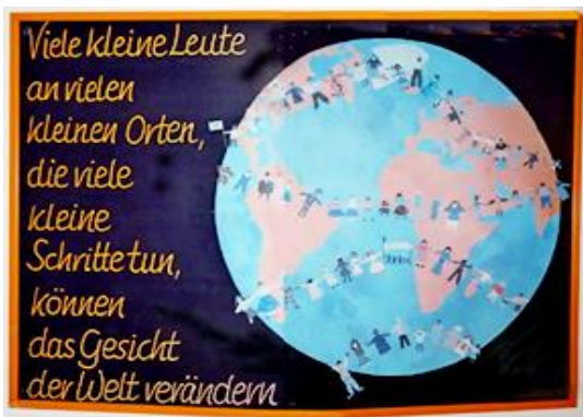
Mooie plaat aan de muur in de Juugend Akademie

Op deze bonte avond deden de jongeren een leuk spel. In een lange rij allemaal met het gezicht dezelfde kant uit, deed de eerste een beweging. Die werd doorgegeven aan de volgende. Het was verbazingwekkend hoe die beweging er na 20 keer anders uitzag. Ook om te zien waar het ergens mis ging en de beweging totaal anders