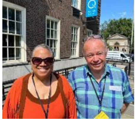
Dick met een Vriendin

S 'Avonds was er de 'Swarthmore lecture' 2024: Getting What We Deserve? Imprisonment and the Challenge of Doing Justice (Krijgen we wat we