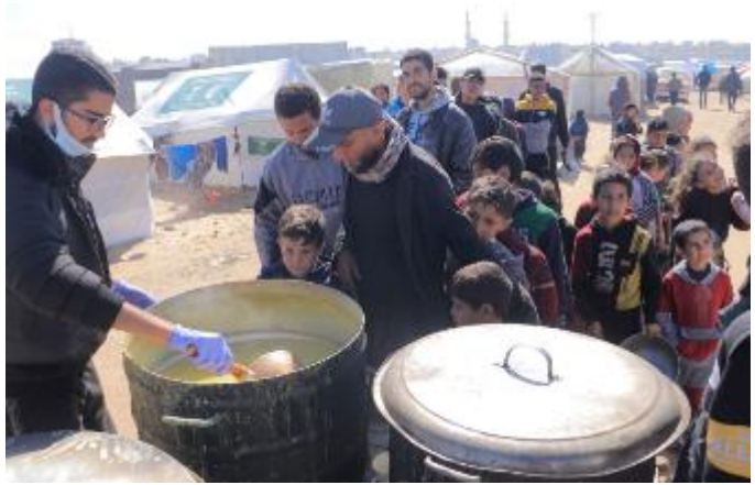
uitdelen van voedsel enige tijd geleden

NGO's die in en aan Gaza werken, hebben opnieuw de verlamme-nde belemmering van de toegang tot hulp benadrukt. Zij ondervinden sterke beperkingen, vertragingen en erbarmelijke omstandigheden voor de levering van hulp in de afgelopen twee