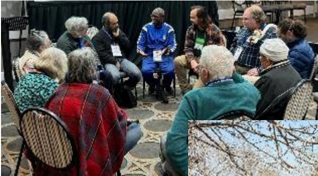
15 augustus, 2024 Johannesburg Zuid-Afrika