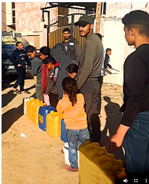
In de rij voor drinkwater, hoe langer, hoe meer een groot probleem

AFSC wil een wereld zonder geweld, ongelijkheid en onderdrukking. Geleid door het Quaker-geloof in het goddelijke licht in elke persoon koesteren we de zaden van verandering en het respect voor het menselijk leven om onze samenlevingen en instellingen fundamenteel te transformeren. Wij werken samen met mensen en partners over de hele wereld, van alle geloofsovertuigingen en achtergronden, om tegemoet te komen aan dringende behoeften van de gemeenschap, onrecht te bestrijden en vrede te creëren.