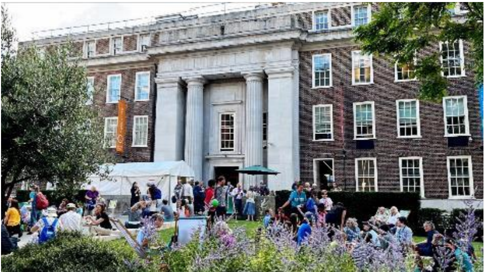
Deelnemers aan de Britse Jaarvergadering voor Friends House in Londen

De Engelse Jaarvergadering heeft haar bijeenkomst samengevat in een Zendbrief. Een prima samenvatting waar ik niks aan toe te voegen heb.