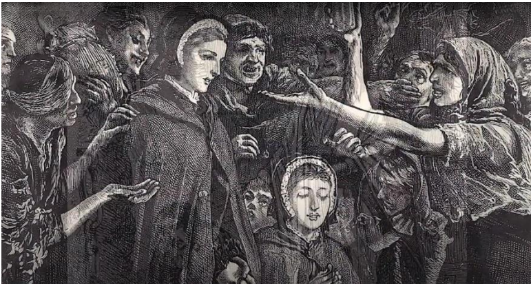
Elisabeth Fry op bezoek in een gevangenis, Artikel komt in het oktober-nummer van de Vriendenkring