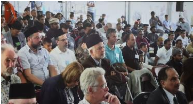
Een blik in de mannentent

voorspeld door Mohammed. Ze geloven dat Jezus na de kruisiging, herstelde en daarna naar Kasjmir reisde. Velen zijn gevlucht uit Pakistan omdat ze daar vervolgd worden. Door andere Moslim groeperingen