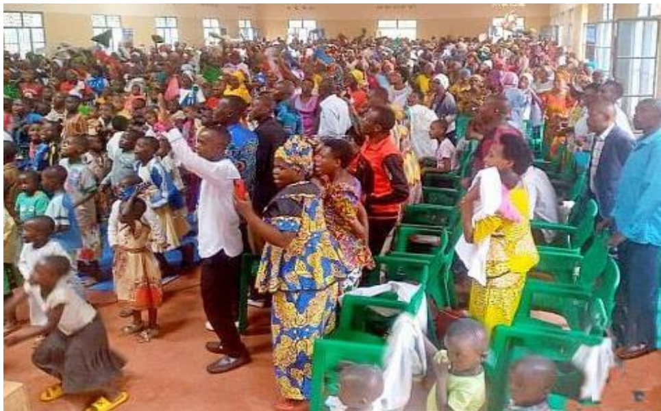
Burundi voorbereidings bijeenkomst van de Afrikaanse Quakers

We worden gegrepen door de dringende noodzaak om transformatief werk in de wereld te doen. Ook wij worden door dat stille zachte stemmetje opgeroepen om stil te staan, om diep naar elkaar en naar de schepping te luisteren. Jeremia 29: 11-14 zegt: 'Want ik ken de gedachten die ik over u denk, zegt de Heer, gedachten van vrede en niet van kwaad, om u een toekomst en