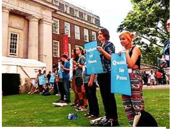
Demonstratie voor Vrede tijdens de BYM

Een Quaker-gemeenschap van alle leeftijden is bijeengekomen in Friends House en online. Videoconferenties hebben een bredere deelname mogelijk gemaakt, maar het kan moeilijker zijn om iedereen in onze sessies op de hoogte te houden. Onze tijd samen omvatte programma's voor kinderen en jongeren, evenals Junior Yearly Meeting. We hebben vertegenwoordigers van andere kerken en geloven verwelkomd, en Vrienden die uit het buitenland op bezoek kwamen. Samen hebben we de 400e verjaardag van de geboorte van George Fox gevierd.