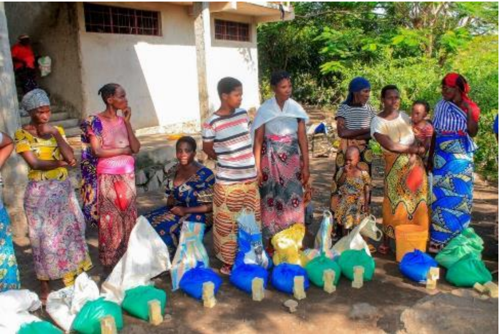
Voedseldistributie in Gatumba Burundi, ondersteund door het Climate Emergency Fund, na overstromingen.

Als u wilt bijdragen aan het Climate Emergency Fund, kunt u dat hier doen.