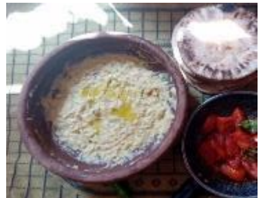
Het voedsel raakt op

Dat kan: NL94 TRIO 0338 4113 64. t.n.v. Quaker Hulpfonds, vermeldt: ‘Haal ze uit Gaza!’